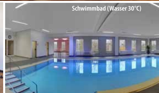
Schwimmbad (Wasser 30°C)

Das 4-Sterne-Parkhotel CUP VITALIS begeistert seine Gäste mit seinem einladenden Ambiente, der traumhaften Aussicht auf Bad Kissingen und die umliegenden Wälder, seinem großen Spa & Sportbereich sowie der 35.000 qm großen Parkanlage, die es umgibt.