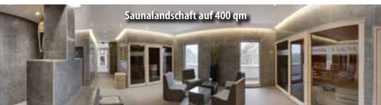
Saunalandschaft auf 400 qm

* Die Kurtaxe (3,50 € p. P./Tag) ist vor Ort zu zahlen.