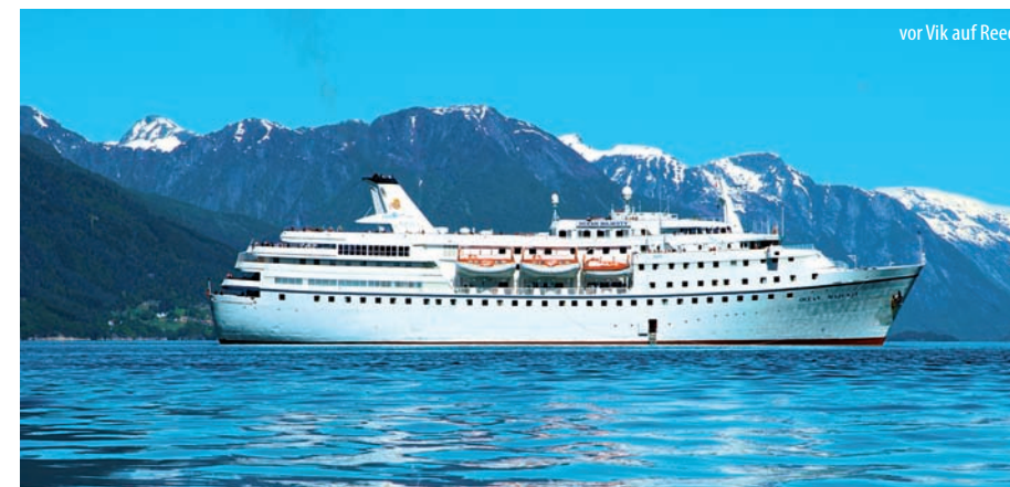
vor Vik auf Reede