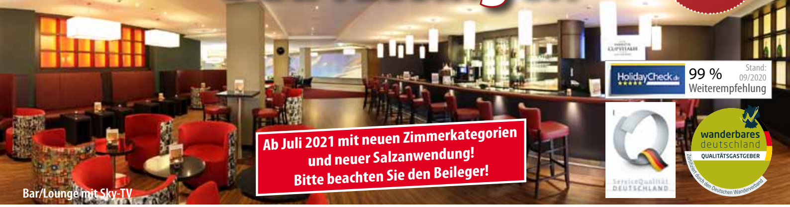
Bar/Lounge mit Sky-TV

Ab Juli 2021 mit neuen Zimmerkategorien und neuer Salzanwendung! Bitte beachten Sie den Beileger!