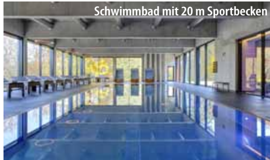
Schwimmbad mit 20 m Sportbecken