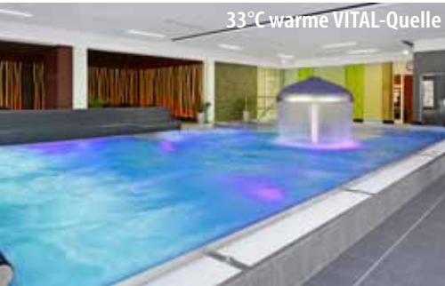
33°C warme VITAL-Quelle