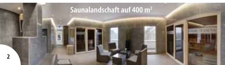
Saunalandschaft auf 400 m²