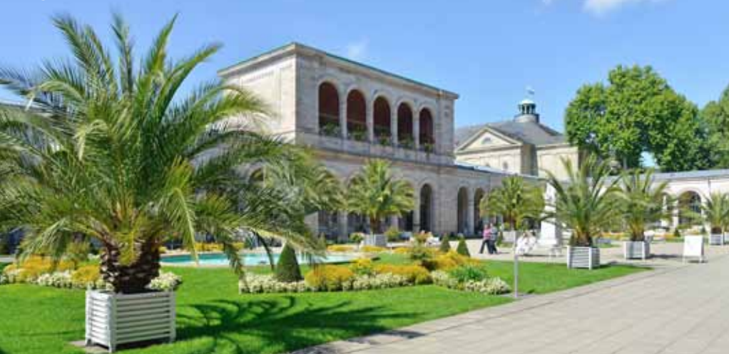
Kurgarten vor dem Arkadenbau