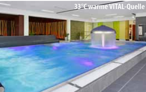
33°C warme VITAL-Quelle