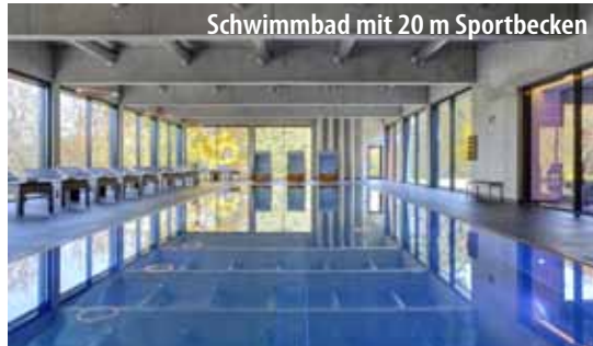
Schwimmbad mit 20 m Sportbecken