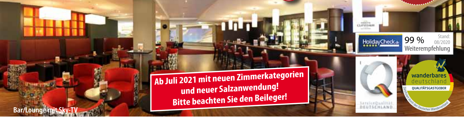
Bar/Lounge mit Sky-TV

Ab Juli 2021 mit neuen Zimmerkategorien und neuer Salzanwendung! Bitte beachten Sie den Beileger!