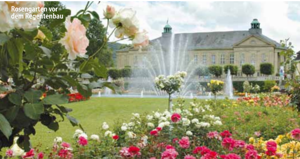
Rosengarten vor dem Regentenbau