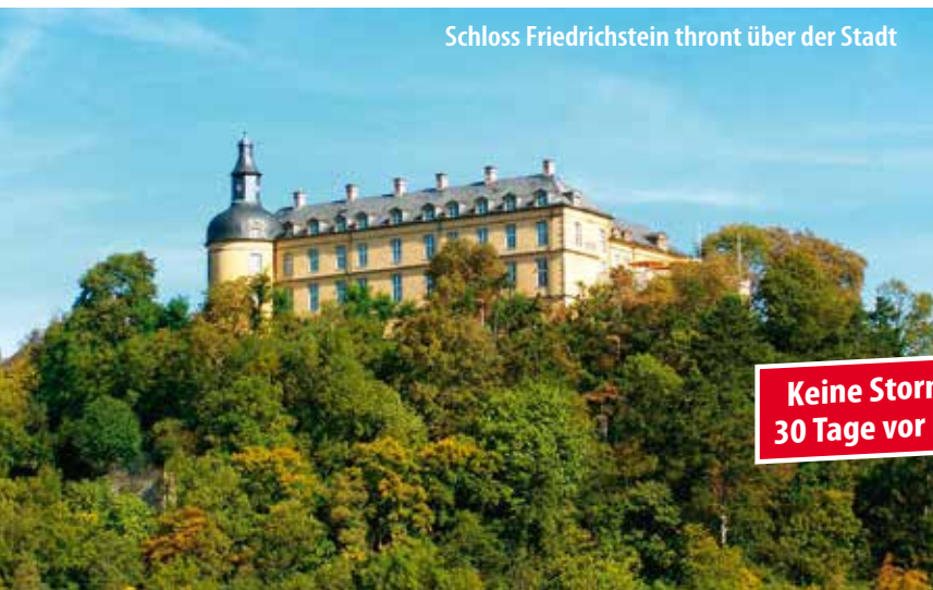
Schloss Friedrichstein thront über der Stadt