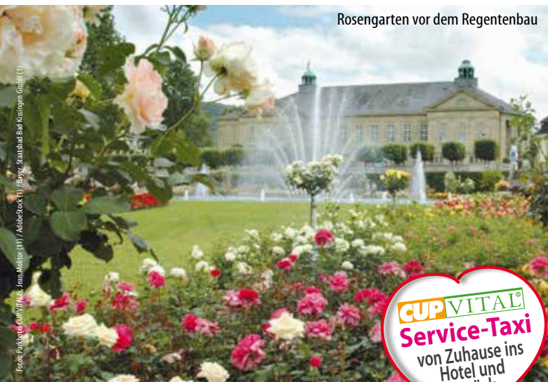
Rosengarten vor dem Regentenbau

CUP VITAL Service-Taxi von Zuhause ins Hotel und zurück