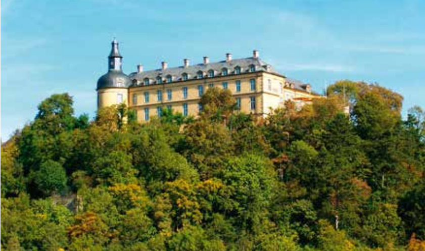
Schloss Friedrichstein thront über der Stadt