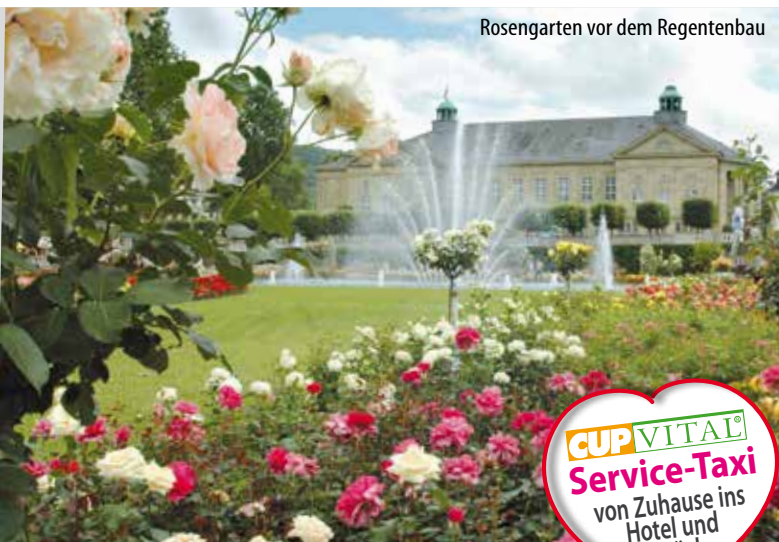
Rosengarten vor dem Regentenbau