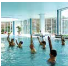
FIT IM ALLTAG