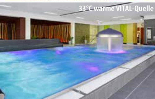
33°C warme VITAL-Quelle