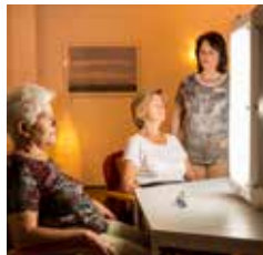
WINTERSONNE * (LICHTTHERAPIE)