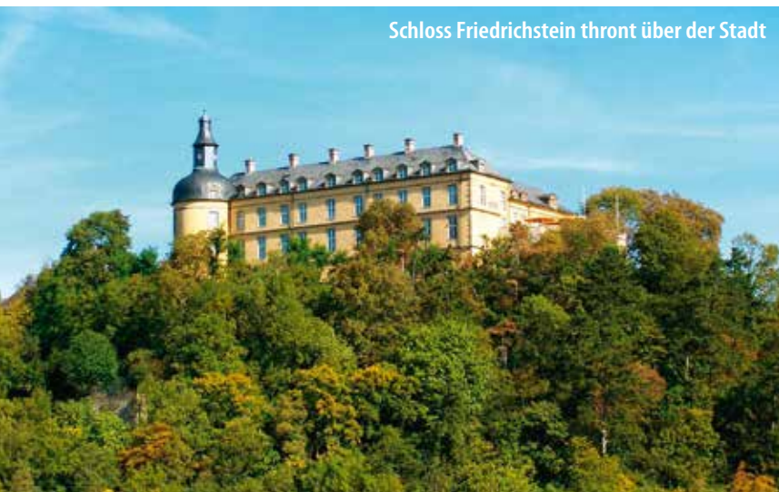
Schloss Friedrichstein thront über der Stadt