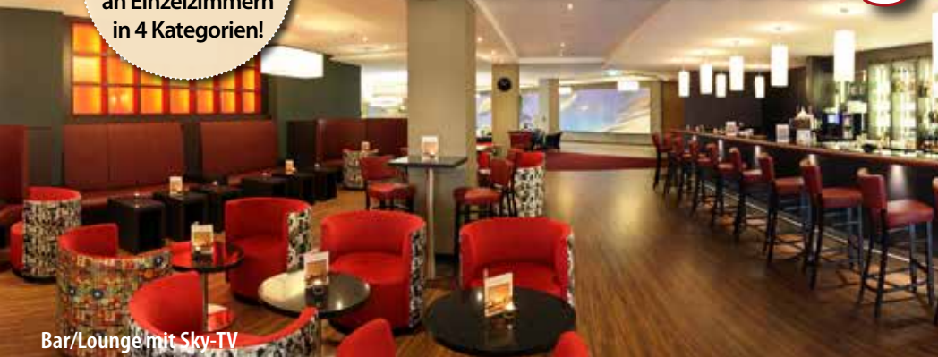
Bar/Lounge mit Sky-TV