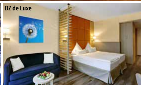
DZ de Luxe

Das 4-Sterne-Parkhotel CUP VITALIS begeistert seine Gäste mit seinem einladenden Ambiente, der traumhaften Aussicht auf Bad Kissingen und die umliegenden Wälder, seinem großen SPA und Sportbereich sowie der weitläufigen Parkanlage, die es umgibt.