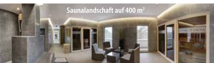
Saunalandschaft auf 400 m 2