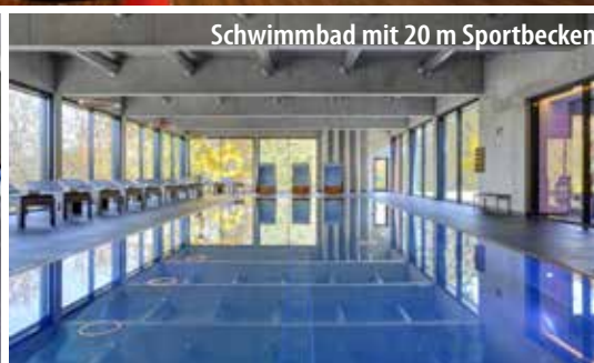
Schwimmbad mit 20 m Sportbecken