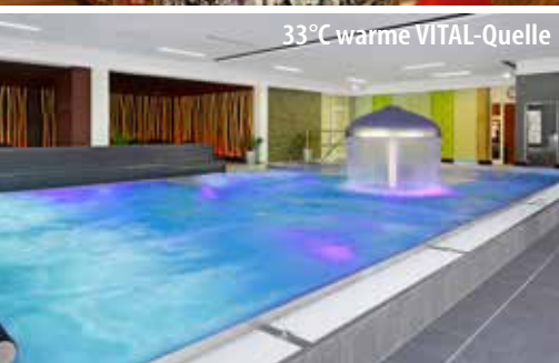
33°C warme VITAL-Quelle