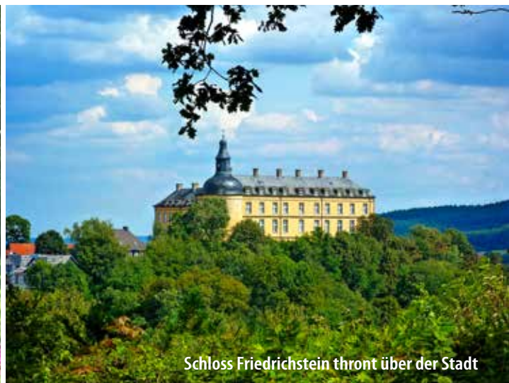
Schloss Friedrichstein thront über der Stadt