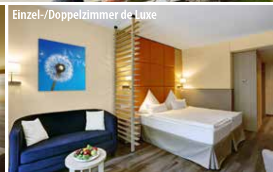
Einzel-/Doppelzimmer de Luxe

Bad Kissingen liegt an der fränkischen Saale, südlich der Rhön im Bundesland Bayern und gehört seit 2021 zum UNESCO-Welterbe „Die bedeutendsten Kurstädte Europas“. Der historische Kurort verkörpert das Phänomen der europäischen Kur auf besondere Art und Weise. Das Bild der Stadt wird vor allem durch die prächtigen Parks und die prunkvollen historischen Bauten geprägt. Hier stehen der Kurpark mit Wandelhalle und Regentenbau sowie die Bayerische Spielbank hervor. Besonders sehenswert sind auch das Bismarck-Museum und die historische Altstadt mit Geschäften und typisch fränkischer Gastronomie. Mit dem CUP VITAL Service-Taxi reisen Sie ganz bequem von Zuhause ins Hotel und zurück!