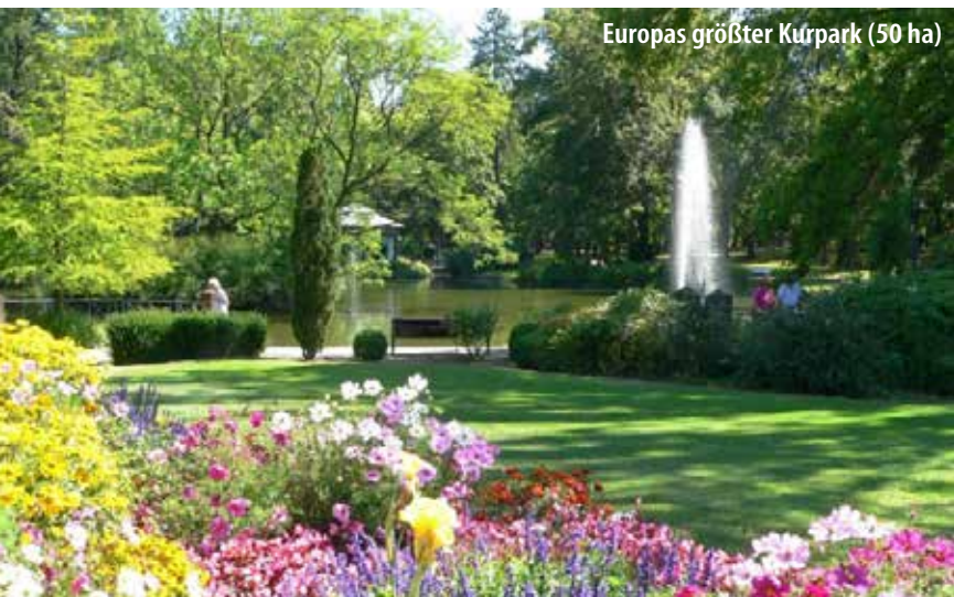
Europas größter Kurpark (50 ha)