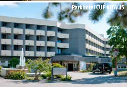
Parkhotel CUP VITALIS