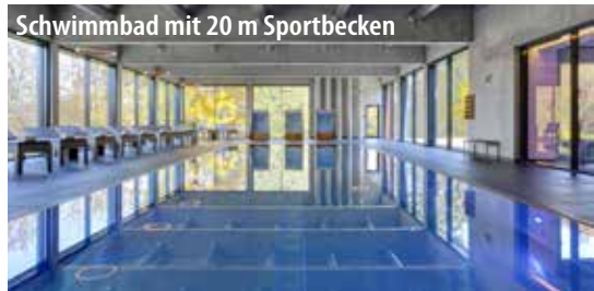
Schwimmbad mit 20 m Sportbecken

Zur kostenlosen Nutzung: Schwimmbad mit 20 m Sportbecken (außerhalb der Kurszeiten), Sonnendeck, 33°C warme VITAL-Quelle mit Sprudelliegen und Massagedüsen, große Saunalandschaft mit Salzsaua (45°C), finnischer Sauna (90°C) sowie 60°C-Bio-Sauna mit großzügigem Ruhebereich und Wellness-Schaukeln sowie zwei separaten Damensaunen.