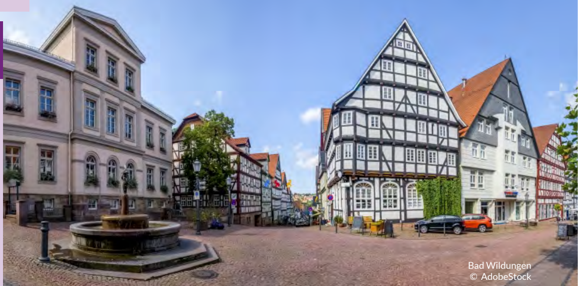
Bad Wildungen

* Haustürtransfer: Region nicht dabei? - siehe Seite 6