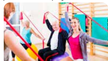
ÜBUNGEN MIT THERA-BAND

Durch den Einsatz verschiedener Hilfsmittel (z. B. Hanteln) werden unterschiedliche Muskeln trainiert und der Spaßfaktor ist gegeben.