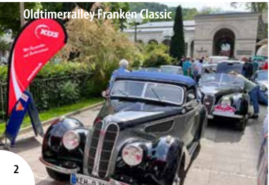
Oldtimerrallye Franken Classic

Informationen zu den Veranstaltungen in Bad Kissingen finden Sie jederzeit aktuell unter www.bad-kissingen.de/veranstaltungen