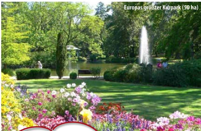
Europas größter Kurpark (50 ha)