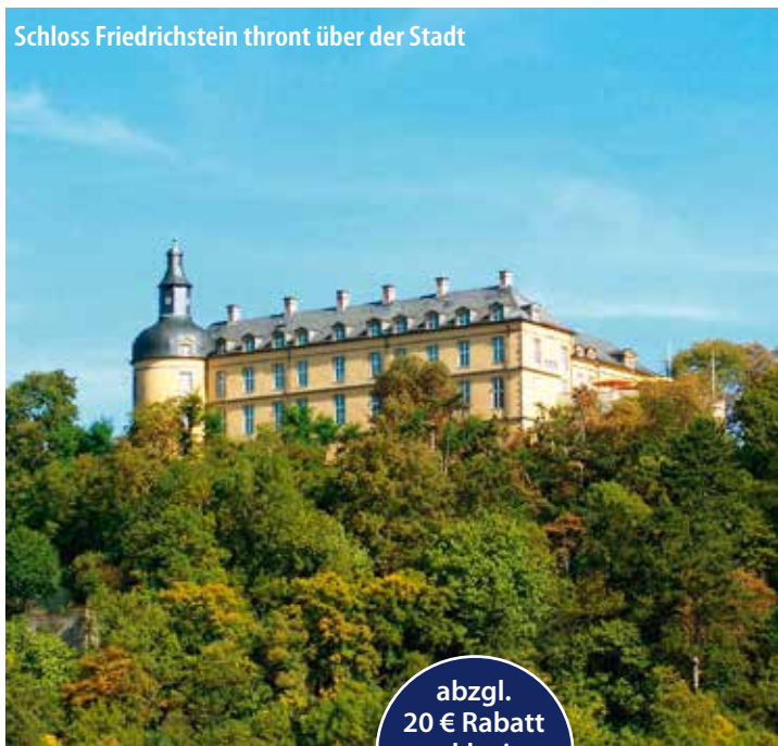
Schloss Friedrichstein thront über der Stadt

Individuelle An- und Abreise mit dem Taxi von Tür zu Tür ohne Umsteigen! 2 bis maximal 6 Gäste Durchführungsgarantie Kofferservice