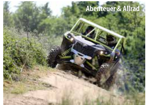
Abenteuer & Allrad