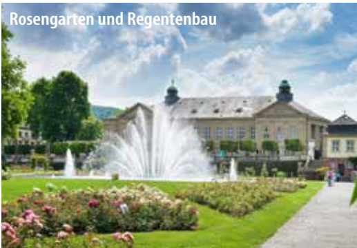
Rosengarten und Regentenbau