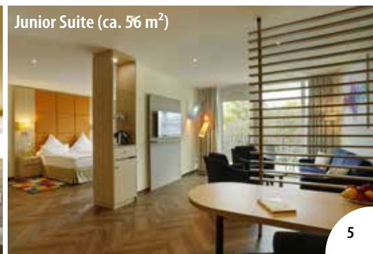
Junior Suite (ca. 56 m 2 )