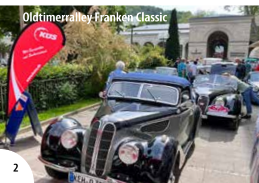
Oldtimerrallye Franken Classic

Informationen zu den Veranstaltungen in Bad Kissingen finden Sie jederzeit aktuell unter www.bad-kissingen.de/veranstaltungen