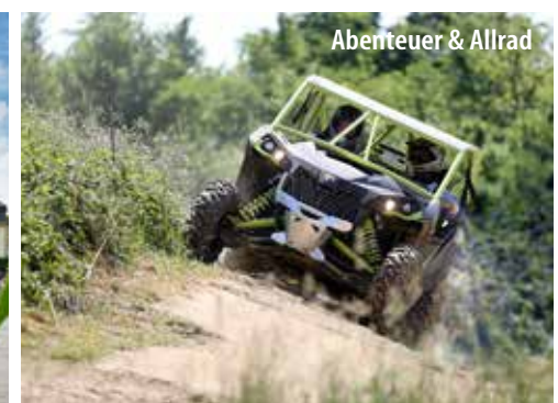
Abenteuer & Allrad