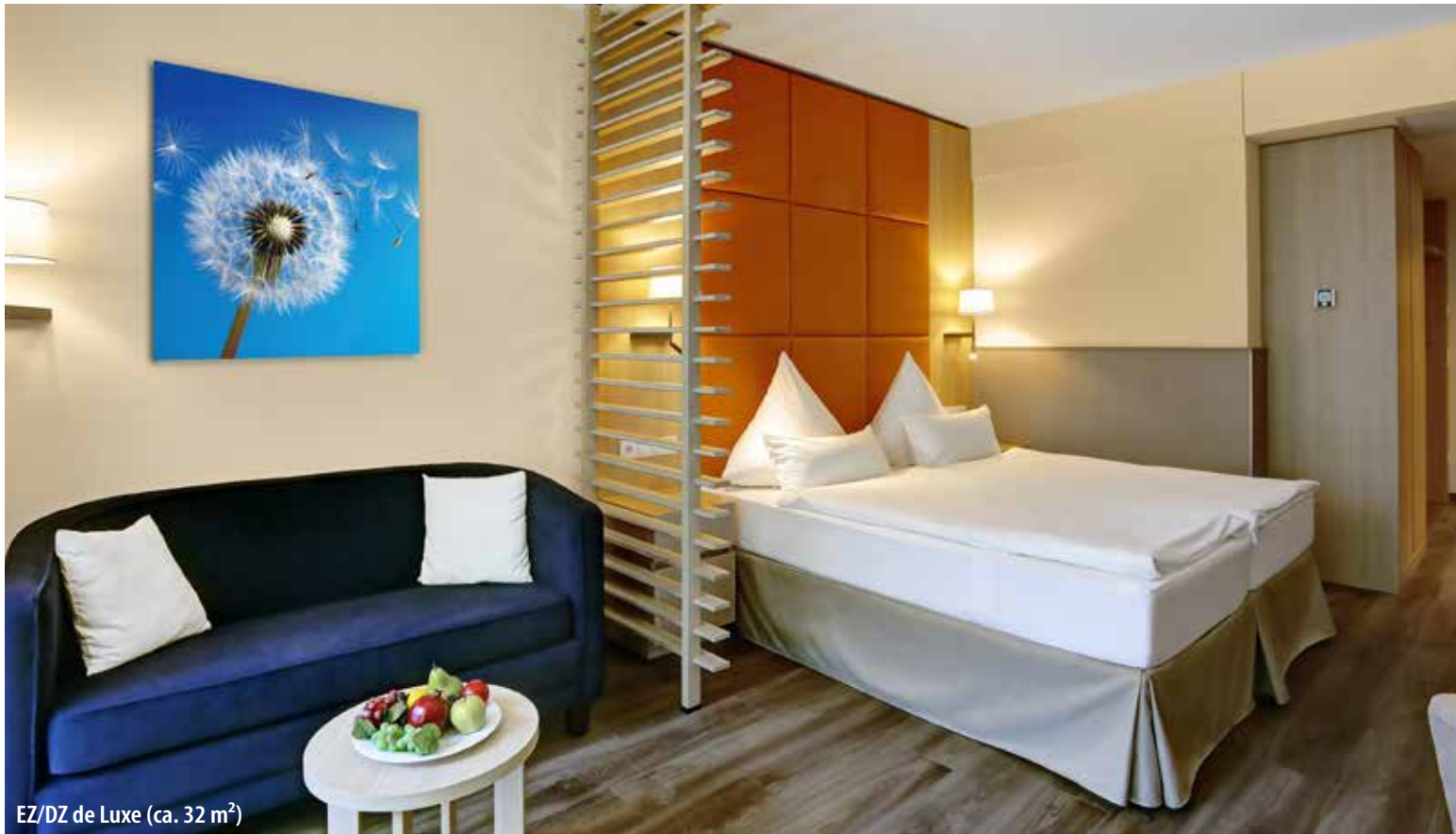
EZ/DZ de Luxe (ca. 32 m 2 )