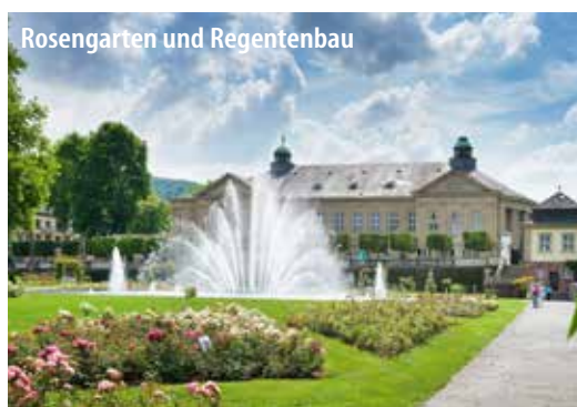
Rosengarten und Regentenbau