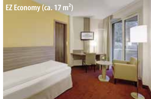
EZ Economy (ca. 17 m 2 )

Zusätzlich zur Grundausstattung bieten Ihnen diese Zimmer: