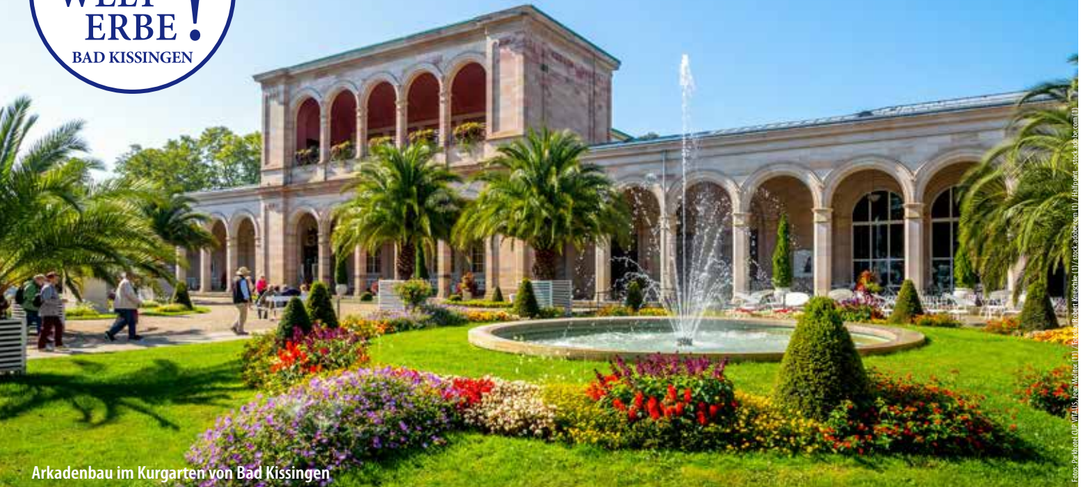
Arkadenbau im Kurgarten von Bad Kissingen

Bad Kissingen liegt an der fränkischen Saale, südlich der Rhön im Bundesland Bayern und gehört seit 2021 zum UNESCO-Welterbe „Die bedeutenden Kurstädte Europas“.