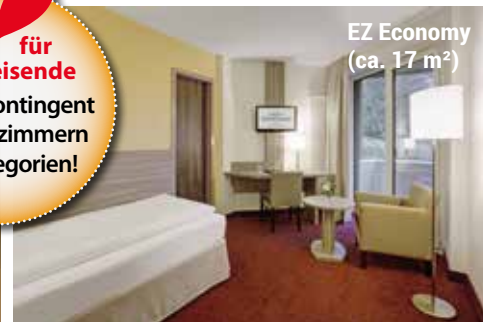
EZ Economy (ca. 17 m²)