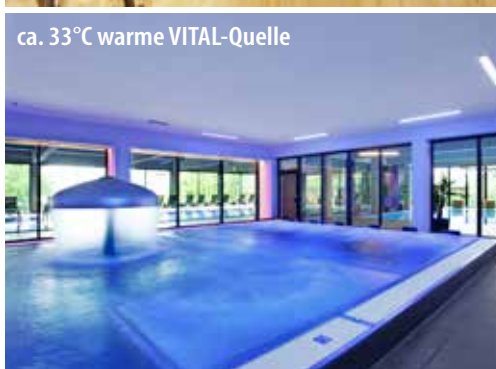
ca. 33°C warme VITAL-Quelle