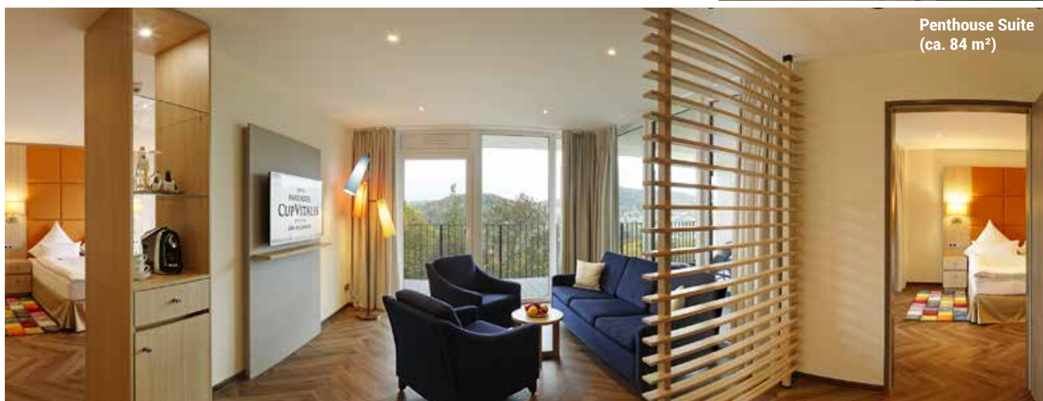
Penthouse Suite (ca. 84 m²)

Buchung & Beratung bei Ihrer GA Leserreisen-Hotline