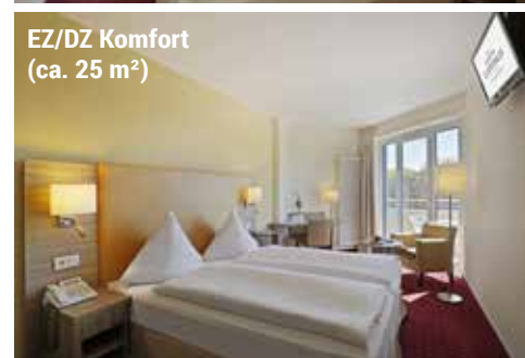
EZ/DZ Komfort (ca. 25 m²)