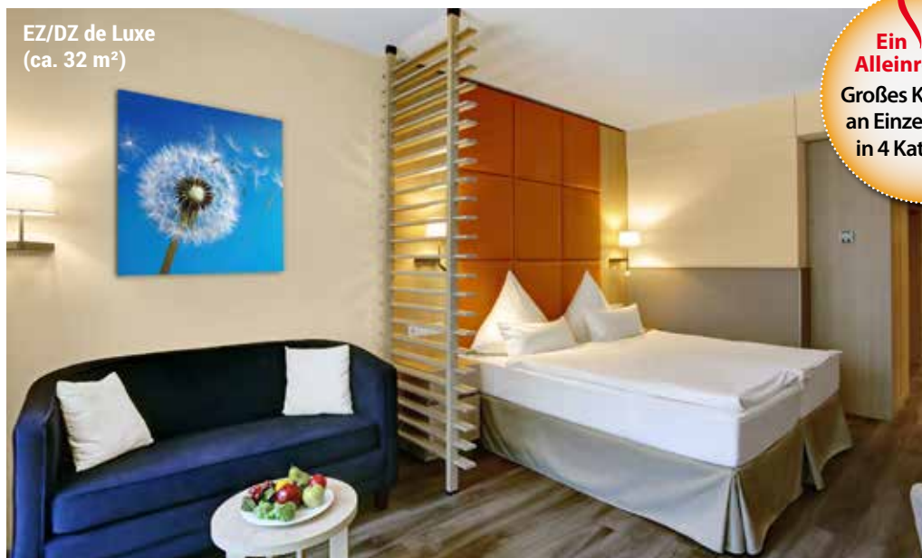
EZ/DZ de Luxe (ca. 32 m²)

Ein für Alleinreisende Großes Kontingent an Einzelzimmern in 4 Kategorien!