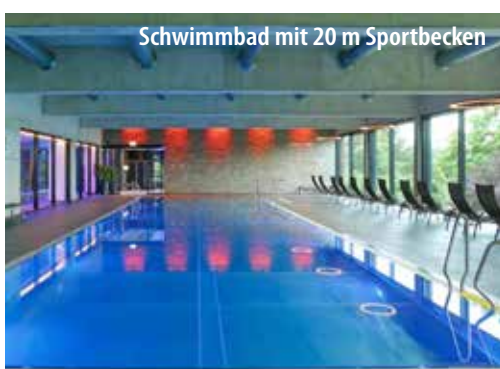
Schwimmbad mit 20 m Sportbecken