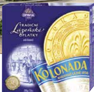
Beliebtes Souvenir: die Marienbader Oblaten

Ausführliche Hotelbeschreibungen finden Sie im CUP VITAL Prospekt Marienbad & Franzensbad 2026 ab Seite 11