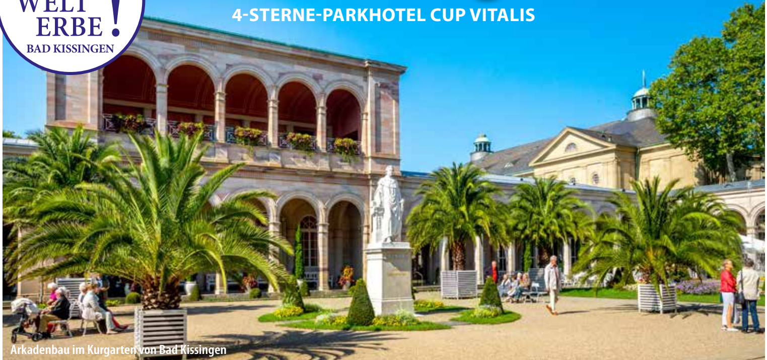
Arkadenbau im Kurgarten von Bad Kissingen

Bad Kissingen liegt an der fränkischen Saale, südlich der Rhön im Bundesland Bayern und gehört seit 2021 zum UNESCO-Welterbe „Die bedeutenden Kurstädte Europas“.