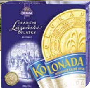
Beliebtes Souvenir: die Marienbader Oblaten

Ausführliche Hotelbeschreibungen finden Sie im CUP VITAL Prospekt Marienbad & Franzensbad 2026 ab Seite 11