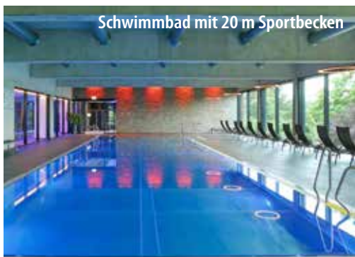
Schwimmbad mit 20 m Sportbecken