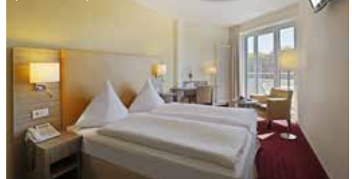
EZ/DZ de Luxe (ca. 32 m²)