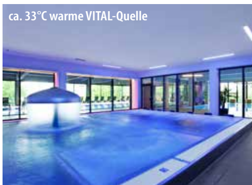
ca. 33°C warme VITAL-Quelle