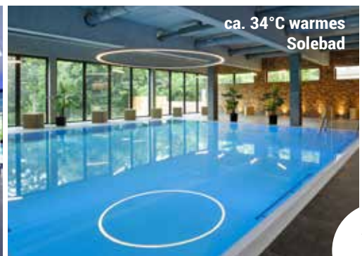
ca. 34°C warmes Solebad