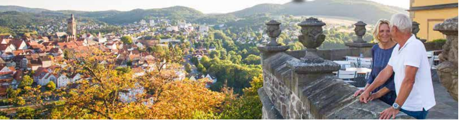
4-Sterne Göbel's Hotel Quellenhof