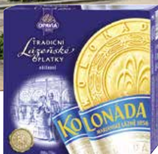
Beliebtes Souvenir: die Marienbader Oblaten