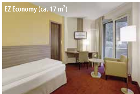
EZ Economy (ca. 17 m 2 )

Zusätzlich zur Grundausstattung bieten Ihnen diese Zimmer: