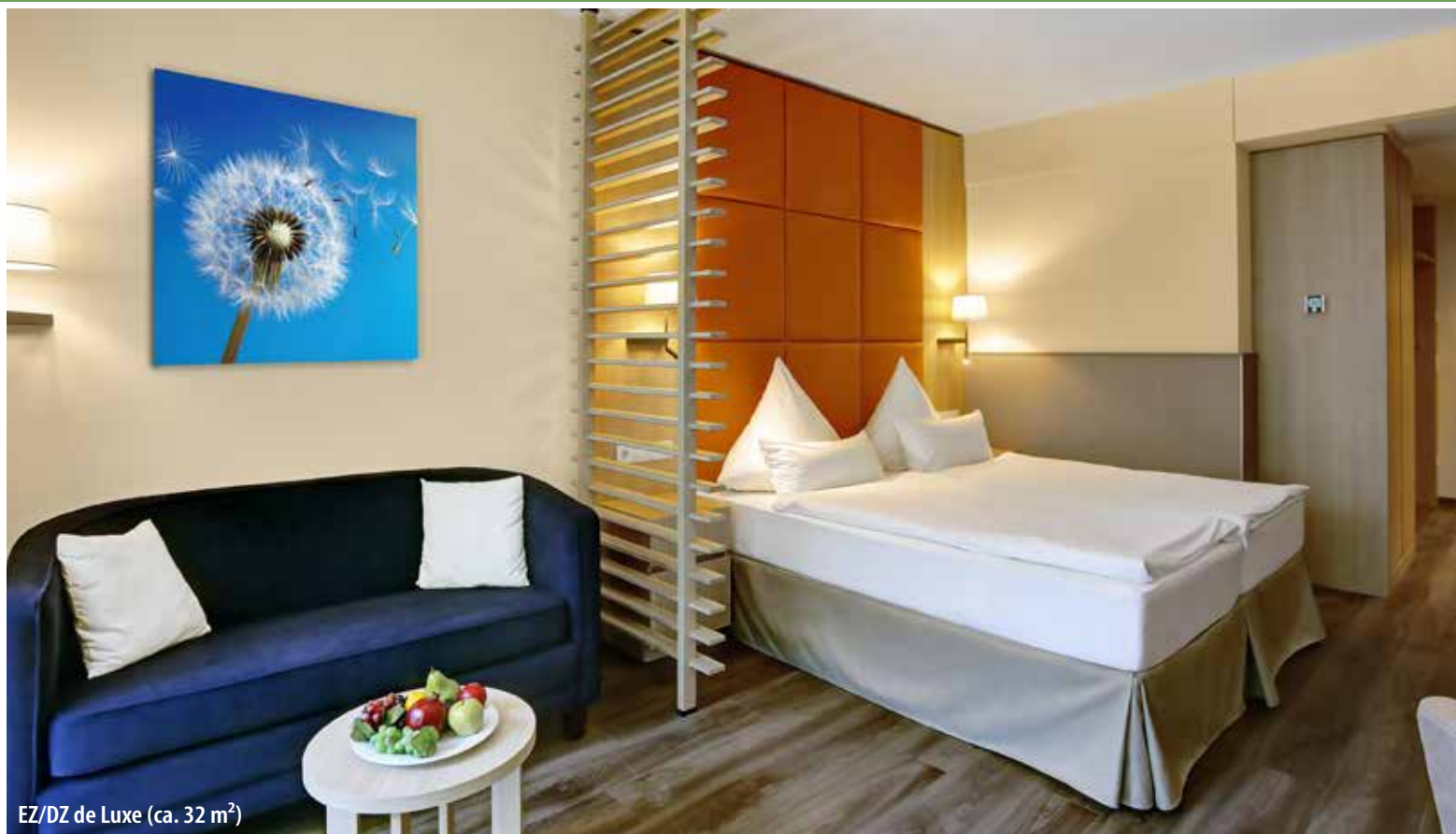
EZ/DZ de Luxe (ca. 32 m 2 )