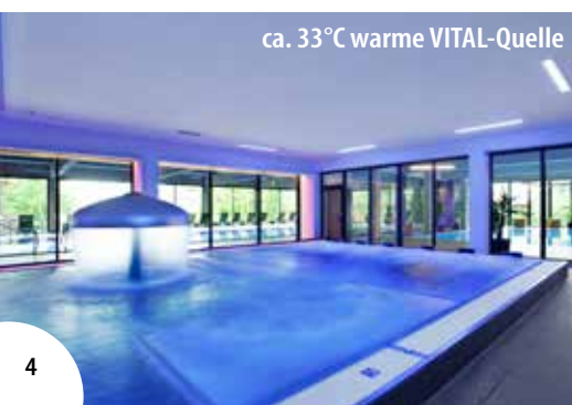
ca. 33°C warme VITAL-Quelle

Während der Sole-Wochen erhalten Sie neben Ihrem Anwendungspaket nach Wahl zusätzlich 3 x Eintritt ins Solebad! Siehe Seite 6.