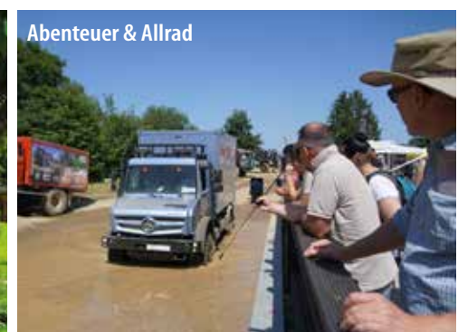
Abenteuer & Allrad