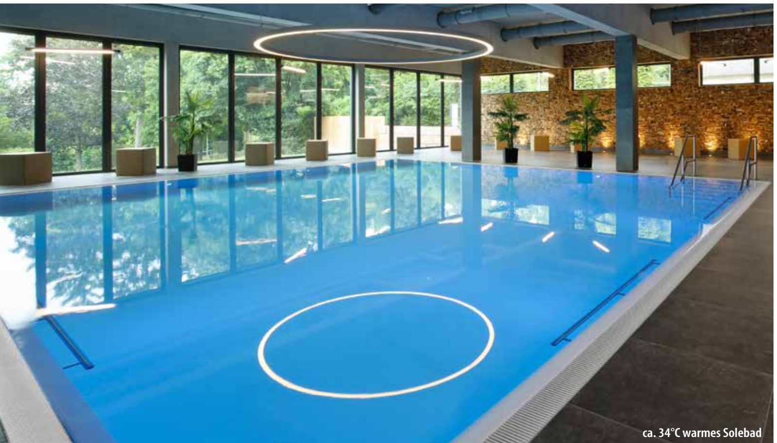
ca. 34°C warmes Solebad

Im Spa & Sportbereich finden Sie auf 3.800 m 2 Zeit für Erholung und Entspannung (teilweise gegen Gebühr). Zur Ausstattung zählen eine Fango-Abteilung und zahlreiche Behandlungsräume, in denen Sie sich mit Lymphdrainagen, Pediküre, Kosmetik sowie mit Teil- und Ganzkörpermassagen verwöhnen lassen können. Zudem bietet Ihnen das Parkhotel CUP VITALIS die Nah-Infrarot-Therapie an. Diese ist im Anwendungspaket „Wärme“ bereits enthalten.