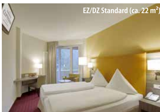
EZ/DZ Standard (ca. 22 m 2 )