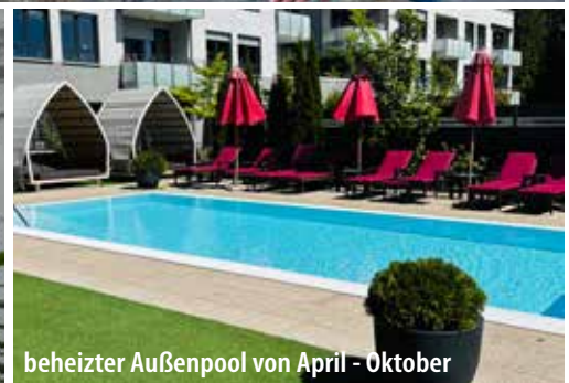
beheizter Außenpool von April - Oktober

Entdecken Sie die Schönheit Bad Wildungen, seines Kurviertels und der Region rund um den Edersee. Ein Spaziergang durch die engen Gassen der Altstadt fühlt sich an wie eine Reise in die Vergangenheit. Schmucke Fachwerkhäuser mit kunstvollen Details und schiefen Winkeln versprühen eine nostalgische Atmosphäre. Die Architektur ist faszinierend und gewährt einen Einblick in vergangene Zeiten. Auf der Wildunger Flaniermeile Brunnenallee findet sich ein Jugendstilhaus neben dem anderen sowie einige sehenswerte Brunnen, zum Beispiel der Kurschattenbrunnen. Der Veranstaltungskalender der Stadt Bad Wildungen sorgt für einen unterhaltsamen Aufenthalt – von Stadtfesten über Ausstellungen bis hin zu größeren Festivals. Das Kurviertel von Bad Wildungen ist bekannt für seine mondänen Bauten und den großen Kurpark. Die Wandelhalle, ein zentraler Treffpunkt, wurde vor vielen Jahren umgebaut – modern und trotzdem traditionell. Bei einem Ausflug können Sie Hessens einzigen Nationalpark Kellerwald-Edersee erkunden. Bad Wildungen ist zu jeder Jahreszeit attraktiv und ideal für einen Gesundheitsurlaub!