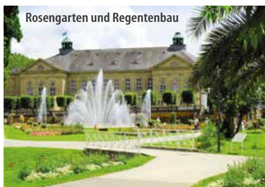
Rosengarten und Regentenbau

Informationen zu den Veranstaltungen in Bad Kissingen finden Sie jederzeit aktuell unter www.bad-kissingen.de/veranstaltungen .