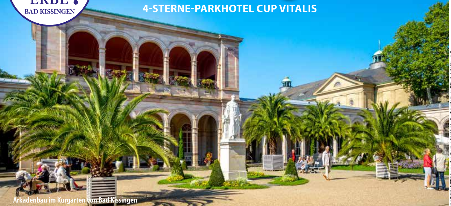
Arkadenbau im Kurgarten von Bad Kissingen

Bad Kissingen liegt an der fränkischen Saale, südlich der Rhön im Bundesland Bayern und gehört seit 2021 zum UNESCO-Welterbe „Die bedeutenden Kurstädte Europas“.