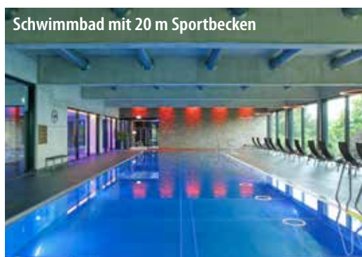
Schwimmbad mit 20 m Sportbecken