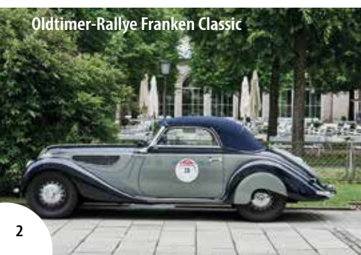
Oldtimer-Rallye Franken Classic

Im Mittelpunkt der 26. Franken Classic steht das attraktive „Rallyezentrum“ im Kurgarten, direkt im Herzen der Stadt. Die Vielfalt der teilnehmenden Fahrzeuge ist einmalig. Über 130 Oldtimer sind auch Pfingsten 2026 wieder bei dieser Oldtimer-Rallye am Start.