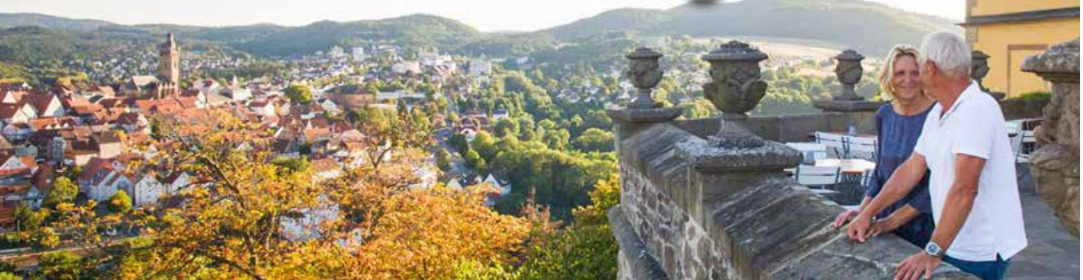
4-Sterne Göbel's Hotel Quellenhof