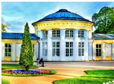
Ferdinandquelle in Marienbad

2.500 qm Acquapura SPA: Die jahrhundertealte Kur- und Gesundheitstradition Marienbads lebt im Grand MedSpa auf. Das Angebot an klassischen Kuranwendungen wird durch moderne physikalische Therapieformen ergänzt und das fachkompetente Team stimmt individuell den Behandlungsplan auf Ihre Bedürfnisse ab. Im Mittelpunkt des Gesundheitsangebots steht die hoteleigene Alexandraquelle, die für Badeanwendungen genutzt wird. Der Acquapura Spa Wellness- und Gesundheitsbereich basiert auf