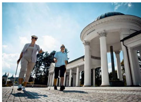
Teilnahme am Nordic Walking

1 Kuranwendungen: Alle Anwendungen, die im Leistungspaket inkludiert sind, erfolgen auf Empfehlung des Hotelarztes nach einem Empfangsgespräch. So sind die Anwendungen individuell auf jeden Gast abgestimmt. Darüber hinaus steht es Ihnen natürlich frei, weitere Behandlungen in Ihrem Hotel ganz nach Ihren Wünschen und Bedürfnissen hinzu zu buchen, da nicht alle Kuranwendungen, die von unseren Vertragshotels angeboten werden, in unserem Leistungspaket enthalten sind (wie z. B. Gero-Aslan-Kur, Darmspülung etc.). Zu den Anwendungen in den Leistungspaketen gehören: z. B. trockenes Gasbad, Perlbad, klassische Massage, Inhalation, Gasinjektion und Elektrobehandlung.