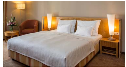
Hotel Falkensteiner Grand MedSpa – Indoorpool, Zimmerbeispiel

den vier Säulen Health, Balneo, Aktiv & Vital und Wellness und lädt mit beheiztem In- und Outdoorpool, Innen-Aktivpool, Solepool, separatem Therapiebecken, Dampfbad, Sauna, Solarium und Fitnessraum zum Wohlfühlen ein. Eine persönliche Wellness-Tasche mit einem Badetuch sowie Bademantel steht Ihnen während Ihres Aufenthaltes gratis zu Verfügung.