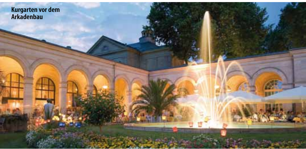
Kurgarten vor dem Arkadenbau