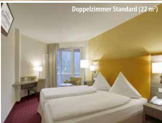
Doppelzimmer Standard (22 m 2 )