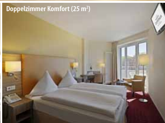
Doppelzimmer Komfort (25 m 2 )