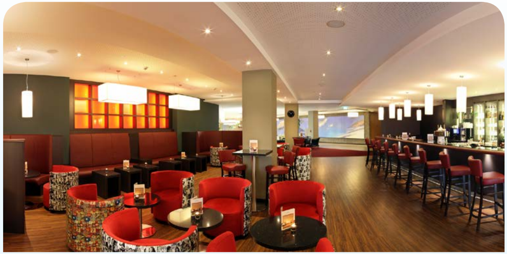
Genießen Sie ein Glas Wein in gemütlicher Atmosphäre

Doch auch die andere Richtung des Kurparks hält fantastische Überraschungen parat. Ob zu Fuß oder mit dem Ausflugsschiff geht es die Saale für rund 2,5 km entlang zur Saline mit Gradierbau. Hier heißt es dann „tief Luft holen“! Im ebenfalls nahe liegenden Altstadt kern finden Sie schöne, kleine Boutiquen, Restaurants, Cafés und typisch fränkische Gastronomie. So viel Erlebnenswertes auf kleinem Raum, kein Wunder, dass schon Persönlichkeiten wie Kaiserin Elisabeth „Sisi“ von Österreich-Ungarn und Fürst Otto von Bismarck Bad Kissingen zu schätzen wussten. Das Bismarck-Museum zeigt heute den Staatsmann aber auch den Privatmann, mit Blick in seine historische Wohnung. Auf „Sisi's Lieblingsspaziergang“ wandern Sie u. a. über den Altenberg zu einer künstlich geschaffenen Steinschlucht bis hin zum Sisi-Denkmal, das zu Ehren der Kaiserin Elisabeth errichtet wurde. Am höchsten Punkt des Altenbergs gibt es einen Tempel mit Aussichtsplattform. Von hier aus genießen Sie einen herrlichen Ausblick auf Bad Kissingen, das umliegende Saaletal und die Ausläufer der Rhön. Weitere empfehlenswerte Ausflugsziele sind der Wittelsbacher Turm, der Wildpark Klausshof, die Märchenhöhle Walldorf und das ca. 8 km entfernte Schloss Aschach.