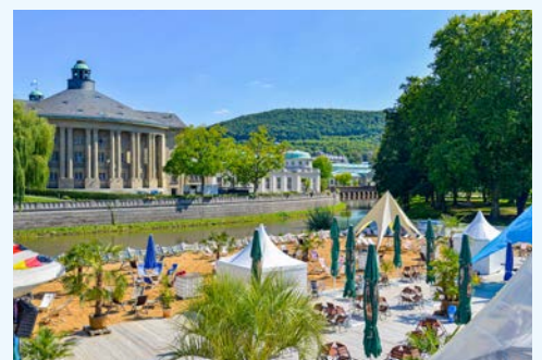
Auch der Stadtstrand an der Saale wird gern besucht

Wie aus einem Kinderbuch entsprungen, wirkt das niedliche, kleine, weiß-blaue Kurbähnle, womit Sie bequem die Stadt erkunden können. Die Strecke zwischen Innenstadt und Tierpark Klaushof wurde zunächst mit einem VW Bulli abgedeckt, heute tourt bereits die dritte Generation der beliebten Kleinbahn durch die Straßen Bad Kissingens.