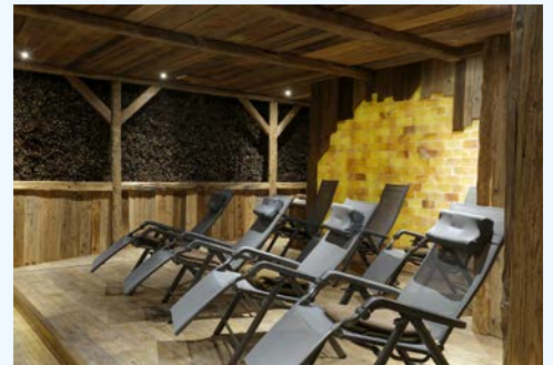
Im hoteleigenen Gradierwerk

Dieses imposante Bauwerk sollten Sie nicht verpassen, zumal er hervorragend zu Fuß oder per Ausflugsschiff mit Abfahrt im Rosengarten zu erreichen ist. Im Volksmund heißt er „Saline“, wobei er nur ein Überbleibsel der ursprünglichen Salzgewinnungsanlagen (Salinen) darstellt. Die einstige Gesamtlänge von 2,2 km kann die Anlage nicht mehr vorweisen, was nach der Einstellung der Salzgewinnung auch nicht mehr nötig war. Als therapeutisches Element gewann der Gradierbau dagegen immer mehr an Bedeutung. Unternehmen Sie einen Wandelgang durch den Gradierbau und stellen Sie fest, wie wohltuend das bewusste Einatmen der reinen, salzhaltigen und gesunden Luft sein kann.