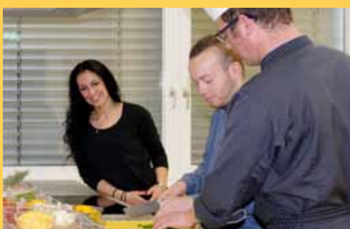
Kochstudio im Parkhotel CUP VITALIS