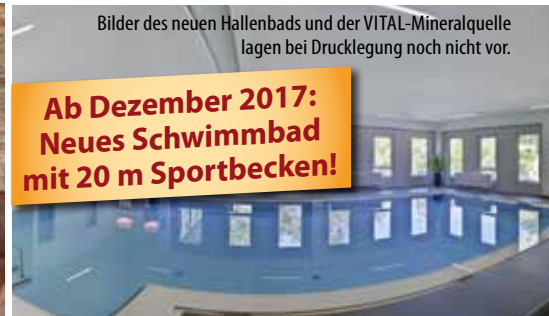
Bilder des neuen Hallenbads und der VITAL-Mineralquelle lagen bei Drucklegung noch nicht vor.

Ab Dezember 2017: Neues Schwimmbad mit 20 m Sportbecken!