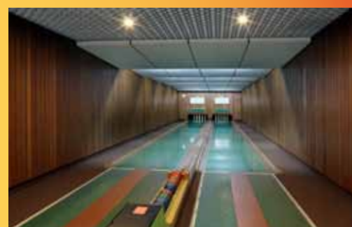
Kegelbahnen im Parkhotel CUP VITALIS