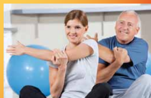
Rückengymnastik im Parkhotel CUP VITALIS