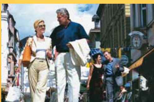
schöne Altstadt zum Flanieren