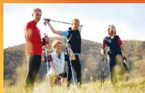
Nordic Walking und Wandern