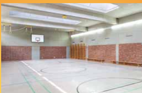
Sporthalle im Parkhotel CUP VITALIS