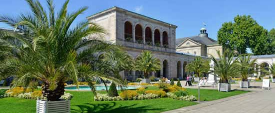
Kurpark mit Wandelhalle