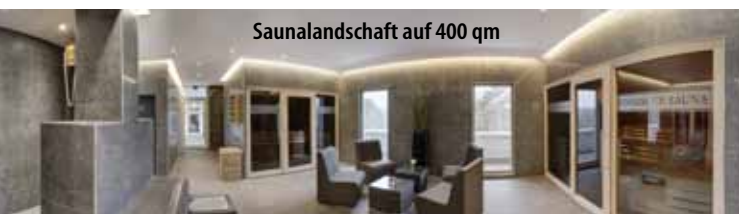
Saunalandschaft auf 400 qm